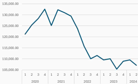
Monto de deuda privada no financiera externa bruta, millones de dólares